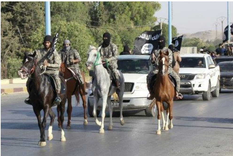
Militaire parade in 'IS-hoofdstad' Raqqa. Het leger van de terreurgroep groeit nog altijd

Westerse luchtaanvallen en speciale operaties verzwakken wel het leiderschap van IS. De IS-leider verantwoordelijk voor de olie- en gashandel werd onlangs gedood bij een actie van Amerikaanse commando's in Syrië. Andere hooggeplaatste leiders kwamen om bij luchtaanvallen. Het gerucht gaat dat kalief Abu Bakr al-Baghdadi deels verlamd is geraakt bij zo'n aanval.